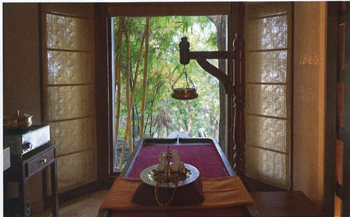
Рядом с Ananda in the Himalayas расположено два города: Ришикеш и Харидвар. Оба – центры паломничества адептов йоги, индуизма и буддизма

макаки, ученики в белых пижамах постигают азы медитации и ведут душевительные беседы с наставниками. По степени осведомленности учителей в йогической казуистике и теософии и по царящей здесь отлаженной безмятежности Ananda in the Himalayas вполне можно было бы назвать образцовым ашрамом. Однако сам дворец, сервис, сюиты с садами, беседками и водопадами для пранаямы и кухня, пусть и согласующаяся с типом доши гостя, но несомненно гурманская, уводят курорт от аскезы в сторону бутик-отелей и мировых стандартов гостиничного бизнеса. Адепты минимализма скажут, что телу и комфорту здесь уделяют слишком много внимания, но жители больших городов, путешественники и гедонисты возразят: именно благодаря отсутствию ограничений, строгих правил и необходимости следовать предписаниям физиче-